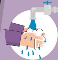
Operi ruke prije nego što uzmeš masku