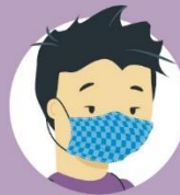
Maskom pokrij usta, nos i bradu