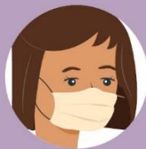
Masku prilagodi licu tako da nema praznina sa strane