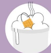
Masku peri najmanje jednom dnevno, najbolje u toploj vodi