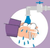
Operi ruke prije skidanja maske