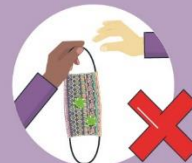
Ne dijeli svoju masku s drugima