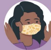
Masku ne dodiruj rukama