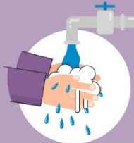
Operi ruke nakon skidanja maske