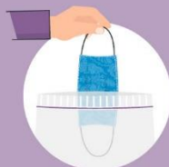
Masku čuvaj u čistoj plastičnoj vrećici