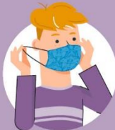
Masku skidaj držeći je za trakice