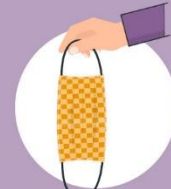
Provjeri da li je maska oštećena ili prljava